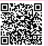
員山院區院長信箱