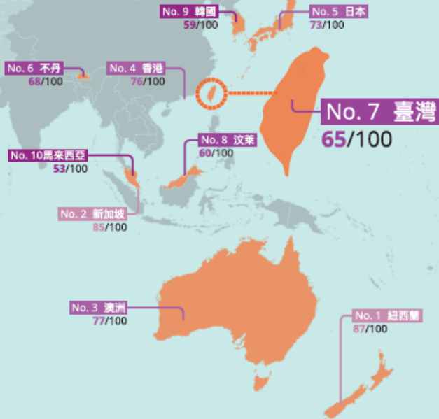
亞太區國家排名前十位置圖